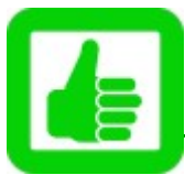
Abbildung: Decathlon Sportspezialvertriebs GmbH,