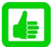
Abbildung: Decathlon Sportspezialvertriebs GmbH,