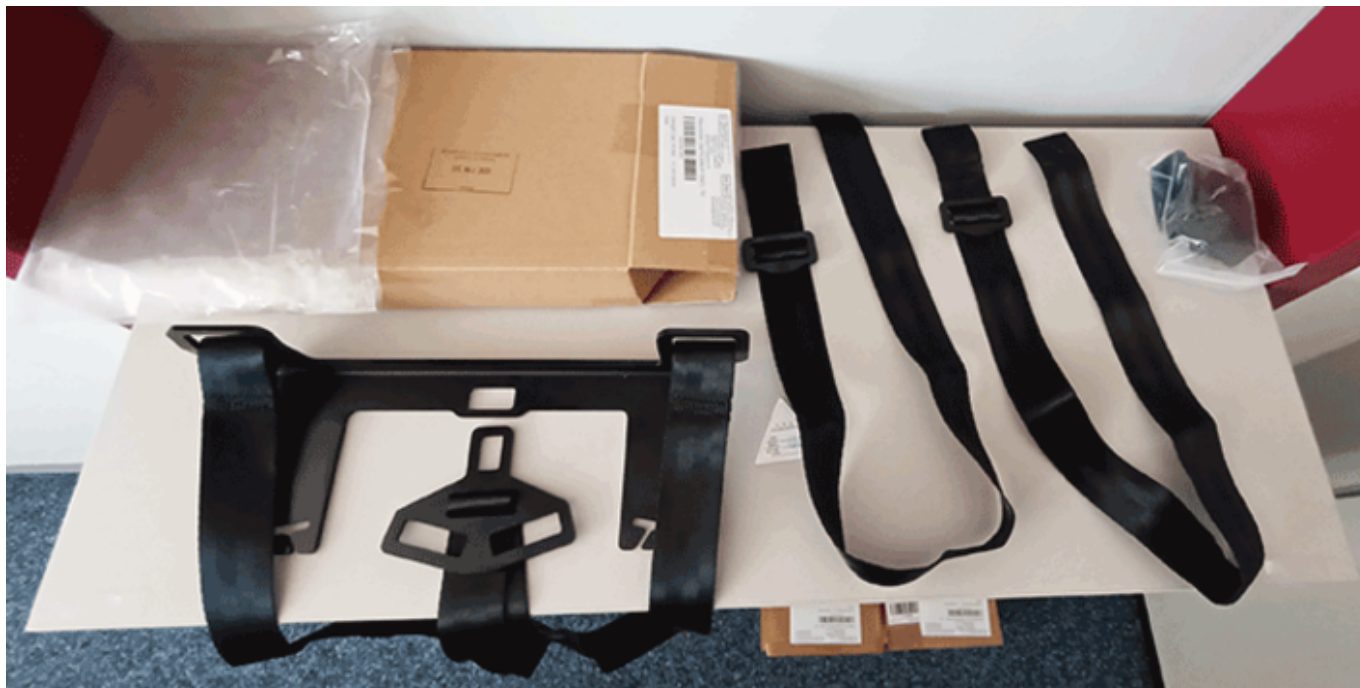
Beispiel eines Universal-Isfix-Adapter