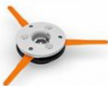
STIHL POLYCUT 27-3