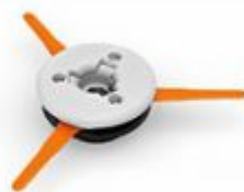
STIHL POLYCUT 47-3