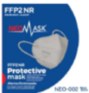
NEO-002, Farbe grau EAN-Code: 4251719943447