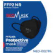
NEO-002, Farbe schwarz EAN-Code: 4251719943331

Artikel: FFP2-Atemschutzmasken „NM-002“ und „NEO-002“