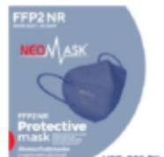
NEO-002, Farbe blau EAN-Code: 4251719943362