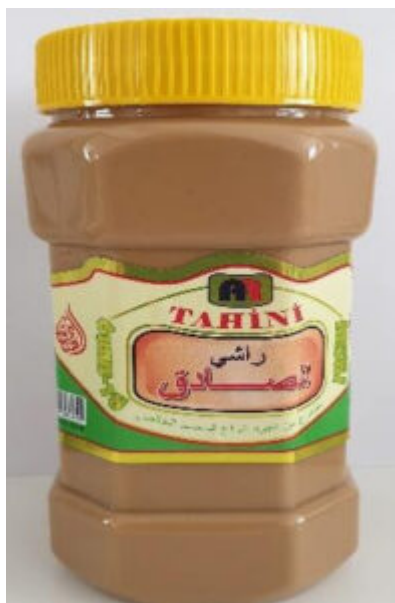
Artikel: Alsadiq Sesampaste