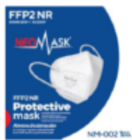
NM-002, Farbe weiß EAN-Code: 4251719902680