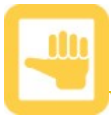
Abbildung: Flying Tiger Copenhagen