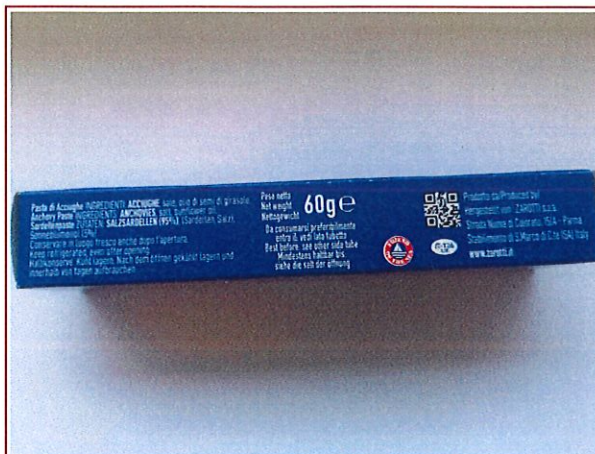
Inserire immagine due: