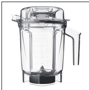
Vitamix 2.0 L Behälter