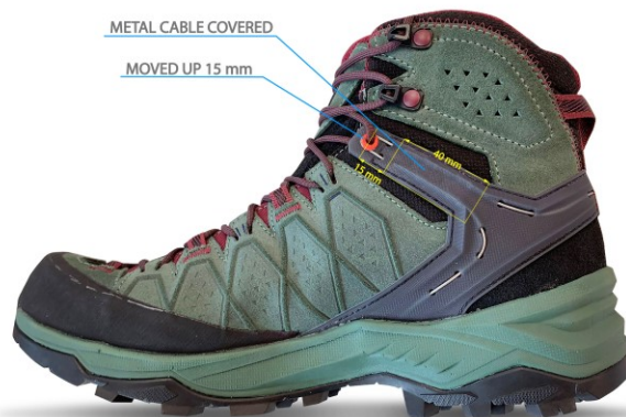
NEUE AUSFÜHRUNG – KEIN RÜCKRUF