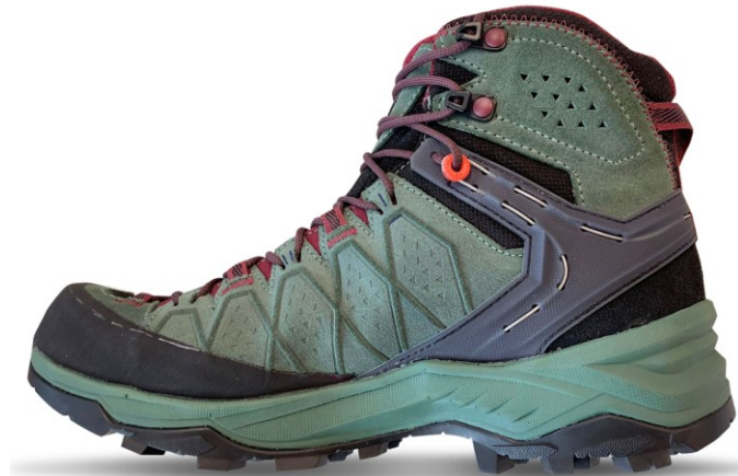
Foto des zurückgerufenen AT2-Stiefels

Zurückgerufene AT2-Stiefel können anhand des Produktionsdatums auf der Innenseite des Zungenetiketts am Stiefel identifiziert werden. Das Produktionsdatum auf dem Etikett beginnt mit „FS“. Aus den Zahlen auf dem Etikett gehen wie folgt Jahr und Monat der Produktion hervor: Die erste Zahl ist die letzte Ziffer des Produktionsjahres und die zweite Zahl bezeichnet den Monat der Produktion. Zum Beispiel steht FS 2-01 für ein Produktionsdatum im Januar 2022.