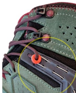
OLD VERSION – SUBJECT TO RECALL