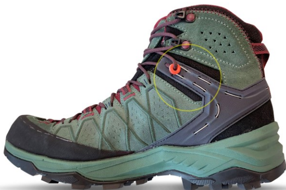
ALTE AUSFÜHRUNG – RÜCKRUF