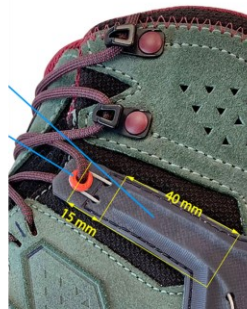
NEW VERSION – NOT SUBJECT TO RECALL

Sie können die Herbst-22-AT2-Stiefel von den zurückgerufenen AT2-Stiefeln unterscheiden, indem Sie die Seiten der Stiefel betrachten: Die Herbst-22-AT2-Stiefel haben ein verdecktes Stahlseil und einen anderen Schnürpunkt (15 mm oder 1,5 cm näher an der Zunge) als die zurückgerufenen AT2-Stiefel.