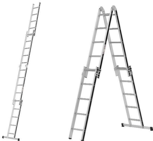
Teleskopleiter ALU-PRO 7006920

Abbildung links: Teleskopleiter in Anlegeposition