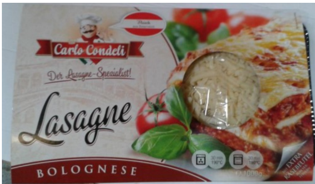
Produkt: Lasagne Bolognese