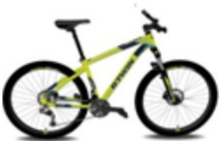
Modell: 2046832 - ROCKRIDER 520 Rahmenfarbe: GELB Rahmengröße: L

die zwischen 1. Oktober 2016 und 6. März 2017 gekauft worden sind