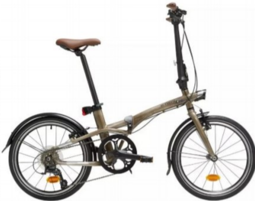
Abbildung: Decathlon SE, Société Européenne