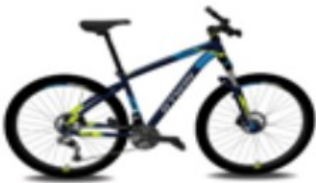
Modell: 2002104 - ROCKRIDER 520 Rahmenfarbe: BLAU Rahmengröße: L