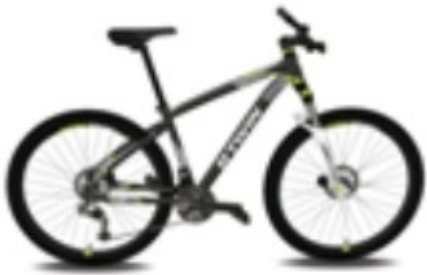
Modell: 1864083 - ROCKRIDER 540 Rahmenfarbe: GRAU Rahmengröße: L