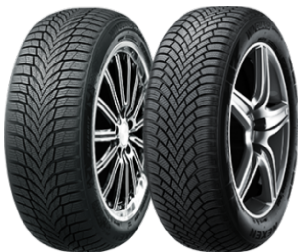
WINGUARD Sport 2